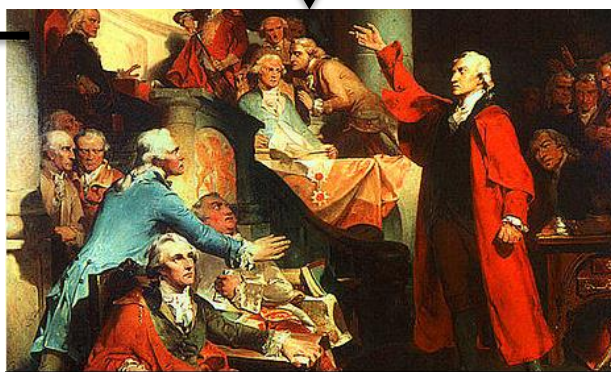
パトリック=ヘンリ