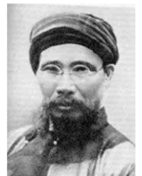
ファン=ボイ=チャウ